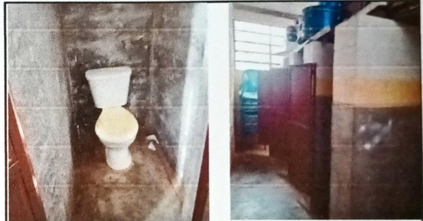
Foto 4: BAÑOS MÓDULO 2 SUSTITUCIÓN DE ACCESORIOS INODORO - SUSTITUCIÓN DE MINGITORIO