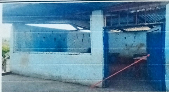
Foto 1: MÓDULO 1 COCINA SUSTITUCIÓN DE PUERTA DE METAL PARA COCINA