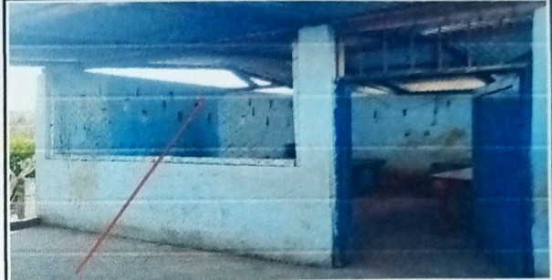
Foto 2: MÓDULO 1 COCINA SUSTITUCIÓN DE BALCÓN DE METAL - PINTURA DE INTERIORES Y EXTERIORES