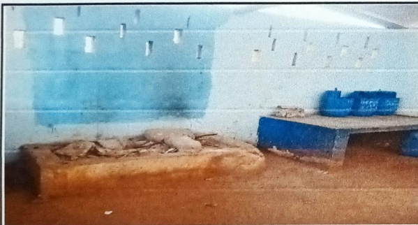
Foto 3: MÓDULO 1 COCINA SUSTITUCIÓN DE ESTUFA RURAL (COMPLETA) INCLUYE CHIMENEA Y PLANCHA DE METAL