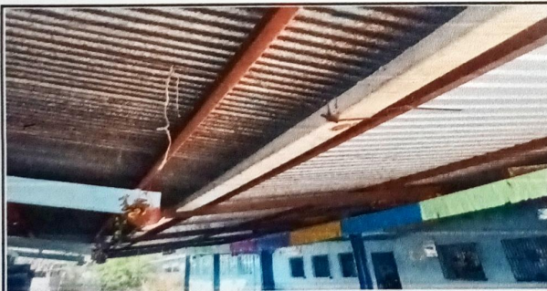
Foto 5: MÓDULO 3 CANALES SUSTITUCIÓN DE CANAL DE METAL Y SOPORTES DE METAL